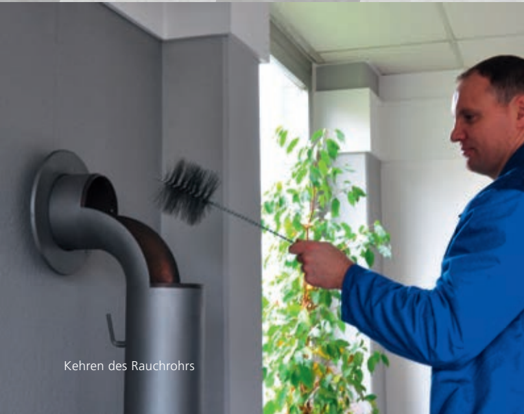
Kehren des Rauchrohrs

Über ein Einstellrad kann der Förderdruck auf den gewünschten Wert begrenzt werden. Die Installation erfolgt im so genannten Raumlufverbund.