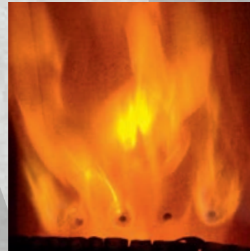
Tertiärluft wird durch Düsen im hinteren Brennraumbereich „eingebblasen“

Zusätzlich oder parallel zur Sekundärluft wird den Brennräumen mancher Öfen noch Tertiärluft durch spezielle Düsen im hinteren Brennraumbereich zugeführt. Dies dient einer weiteren Verbesserung der Vermischung von Brenngas und Luft in der Vollbrandphase.